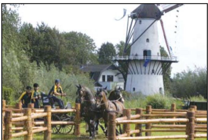
Maratona trase izvietota tipiskā Holandes ainavā.