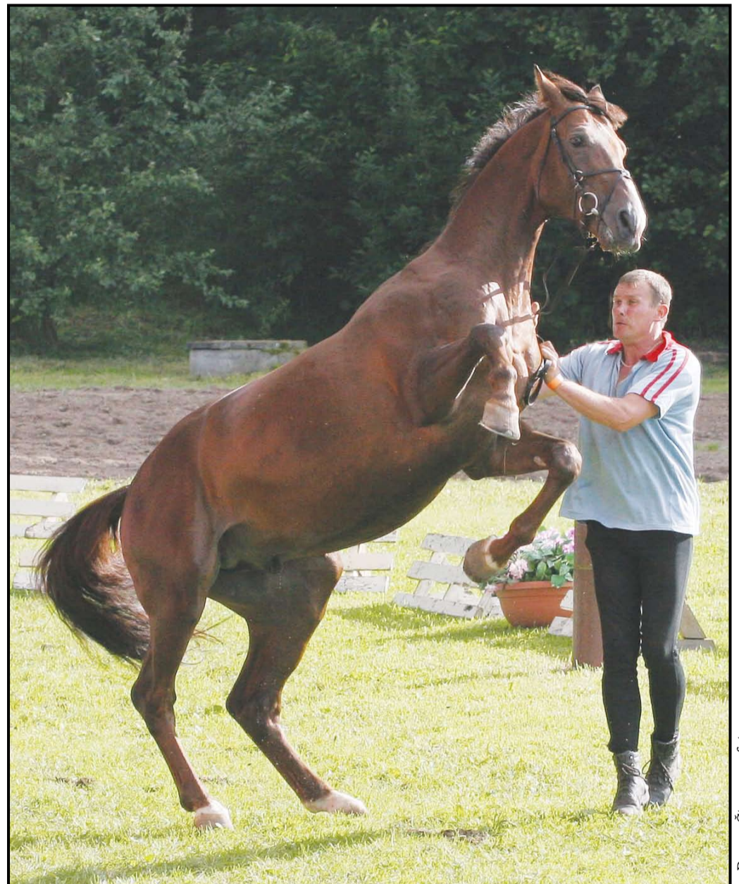
Zirgu veselības pārbaude – izvade pirms šovasar Rīgā notikušā Pasaules kausa izcīņas posma.

Zirgam nav atļauts piedalīties sacensībās, tas jāizolē un jānosūta projām no sacensību vietas pēc iespējas ātrākā laikā.