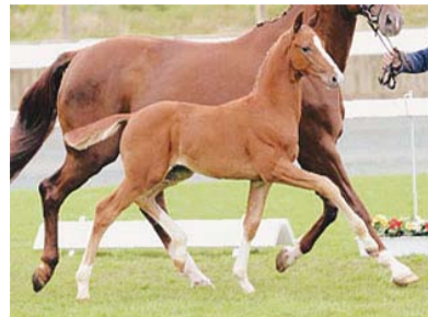
Oldenburgas izsoles dārgākais kumeļš Daktylus.

Rudens ir laiks, kad tiek nošķirti kumeļi. Ne jau katrs kumeļa īpašnieks nolemj turpināt kumeļu audzēt, tādēļ rudens tradicionāli ir izsoļu laiks. Dažas pirmās kumeļu izsoles jau ir notikušas, un kumeļi ieguvuši jaunus saimniekus.