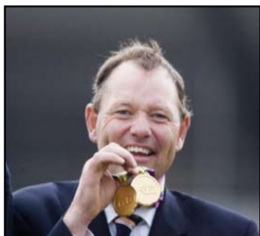
Pasaules čempions četrjūgu braukšanā holandietis Ijsbrands Šardons.

disciplīnās. Uzvarēja jau slavu guvušais braucējs no Nīderlandes Ijsbrands Šardons, kura ekipāža sastāvēja no četriem pamatzirgiem Argus , Isohlas Paganiņi , Isohlas Tango , Tamasson un rezerves zirga Zidane . Otrajā vietā Čestera Vēbera vadītā ekipāža no ASV, bet trešā palika ekipāža no Austrālijas Boida Eksela vadībā. Arī komandu vērtējumā pirmā vieta pienācās Nīderlandei, otrajā vietā Vācijas komanda, bet trešajā vietā Ungārijas braucēji.