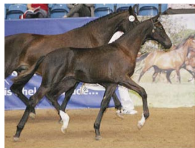
Dānijas Elites kumeļu izsoles rekordists Mollegardens Attention.